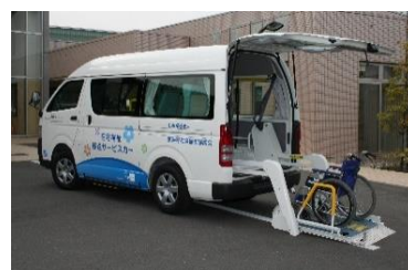
▲貸し出し用福祉車両の整備

ボランティア登録団体や自治会のイベント等の地域活動で活用できるよう、大きなサイズのポスターや横断幕等を印刷する大判プリンターを整備しています。