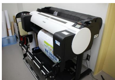
▲大判印刷プリンターの整備

村内6小学校区にある地縁型ボランティア組織『地区社協』の活動をサポートし、誰もが住み慣れた地域でいつまでも安心して暮らし続けるための活動を共に推進しています。