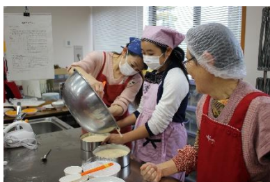
▲『地区社協』活動の支援

村内6小学校区にある地縁型ボランティア組織『地区社協』の活動をサポートし、誰もが住み慣れた地域でいつまでも安心して暮らし続けるための活動を共に推進しています。