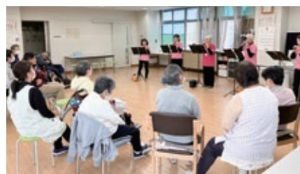
▲レクリエーションでの演奏会 (東海オカリーナクラブ)