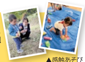
▲どんぐり拾い ▲感触あそび

★対象:村内在住の親子 1歳児(2023.4.2~2024.4.1)…12組 2歳児(2022.4.2~2023.4.1)…12組 ※実施期間は、令和7年5月~令和8年3月まで。