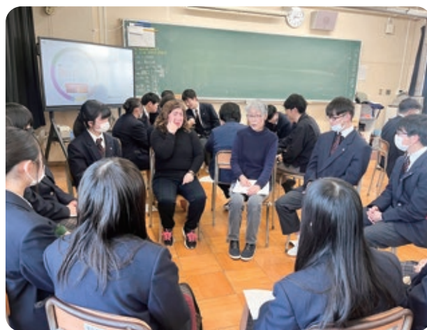
▲東海高校での手話体験学習