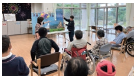
▲読みきかせ会 (だっぺの会)

利用者の皆さまが地域の方々とふれあう機会となり、また当センターの活動を知っていただく貴重な交流の場となっています。今後もこのような機会を増やしていきたいと思っております。ご協力いただきありがとうございます。