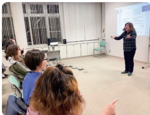
▲手話ボランティア養成講座での活動