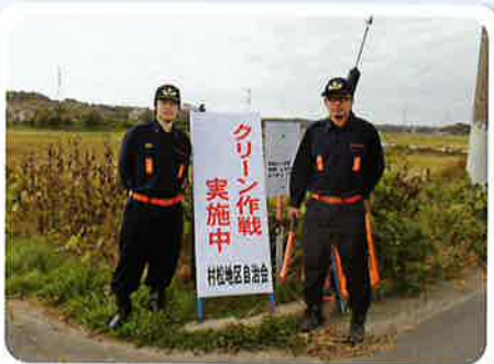
消防団第1分団交通誘導