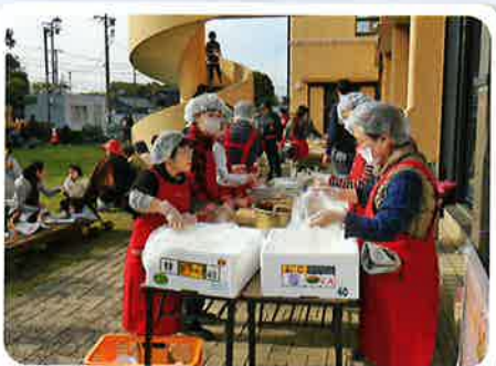
カレーライスもおいしいよ