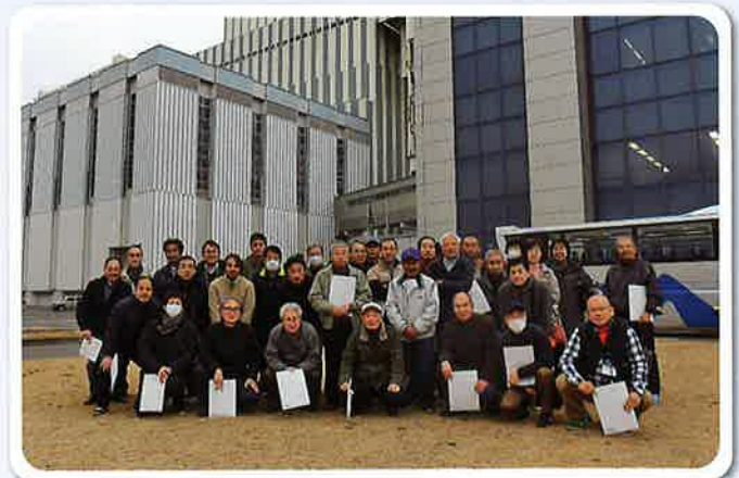
東京電力(株) 常陸那珂火力発電所にて

2018年10月1日に予定の「第13回ふれあい地域まつり」は台風の影響により中止となりました。とても残念に思います。