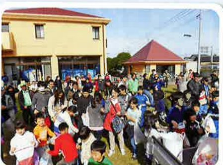
撒き餅いっぱいだったよ