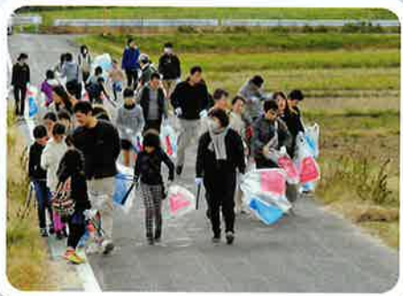
クリーン作戦出発