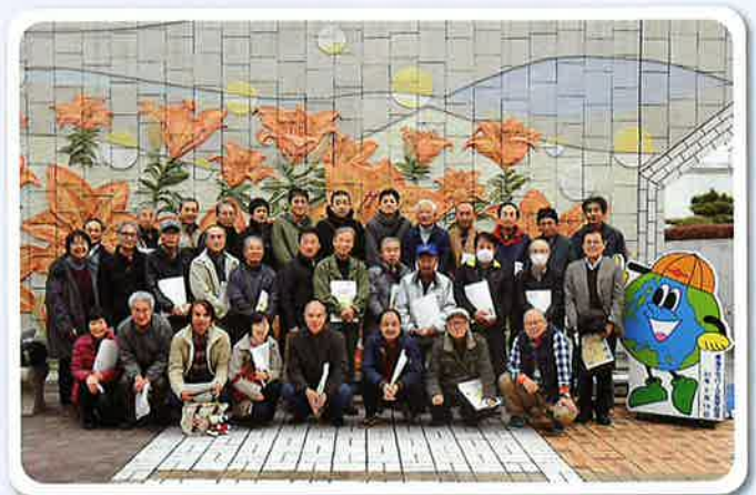
日本原子力発電(株) 東海事業所にて

次に常陸那珂火力発電所では、1,2号機が稼働中で100万KWの発電を僅か5名で自動運転監視していました。高さ230mの排煙塔などの空気汚染対策は、想像を超えるものでした。尚3号機については現在建設中でした。