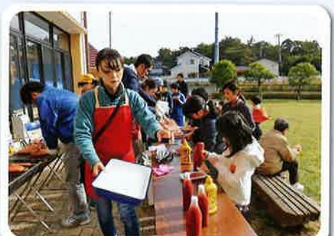
フランクフルトおいしいよ