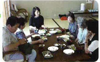
話題もいろいろ (ふれあい食事会)