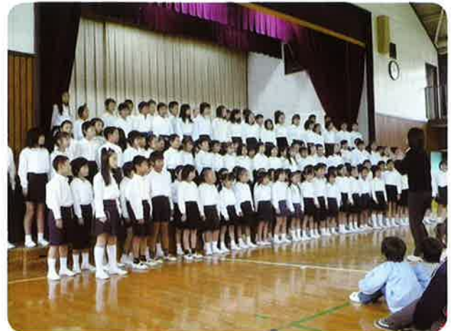
声高らかに照沼小全児童の合唱