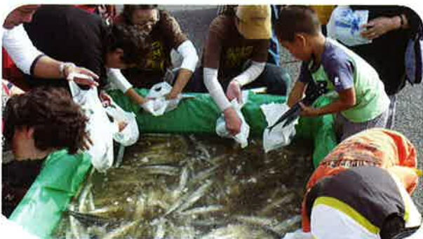
大人も子供も真剣 さんまのつかみ取り