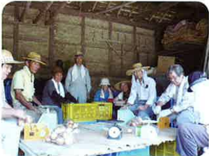
ジャガイモ 玉ねぎの袋詰め作業