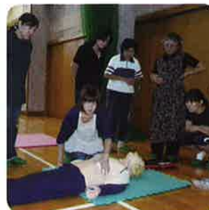
実地体験がすべて