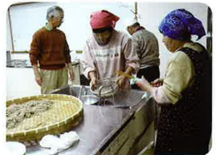
新そばの風味は格別