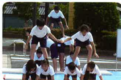
照沼小学校児童の組み体操