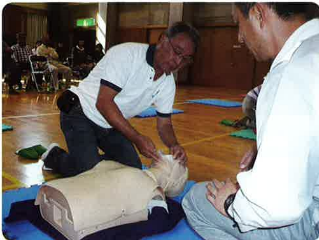
真剣な表情で人工呼吸に取り組む