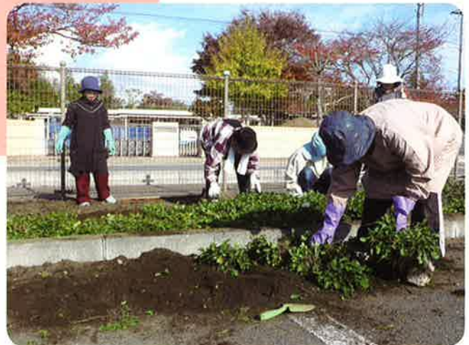
丹精を込めて植え付ける (マーガレット)