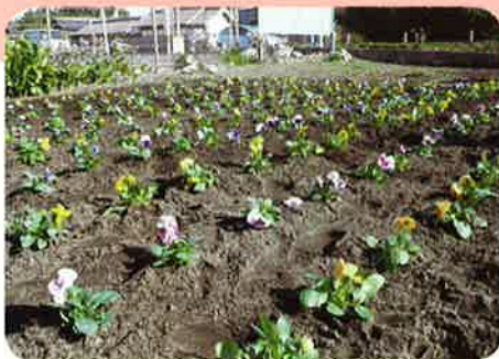
植え付けを終えた花壇 (パンジー)