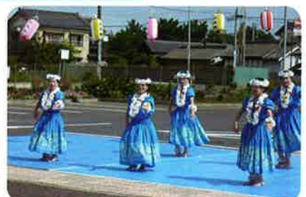
華麗なフラダンス