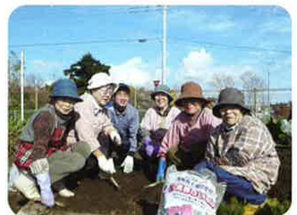
ご苦労様でした (植え付けに参加した部会の方々)