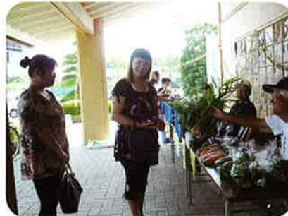
ジャガイモ 玉ねぎの販売