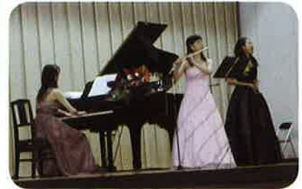
プロの演奏にうっとり

元気いっぱいの幼稚園児の歌と照沼小学校全児童による合唱に加え、今回はプロの演奏家を招き収穫を喜びあいました。