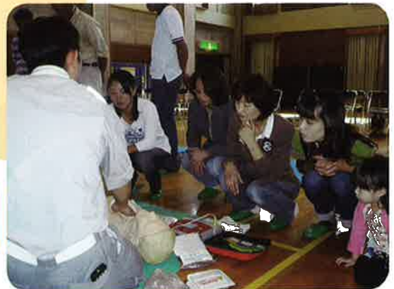
講師の話に耳を傾ける