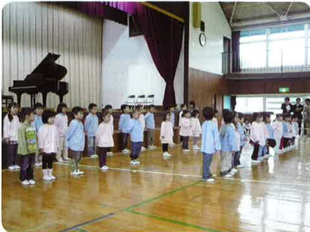
元気いっぱい宿幼稚園児