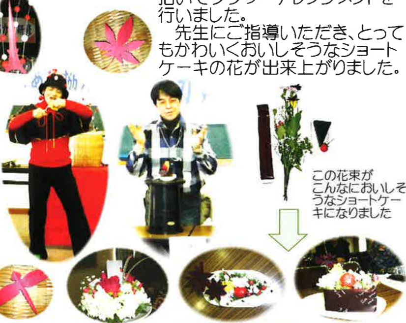
この花束がこんなにおいしそうなおショートケーキになりました