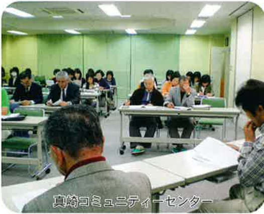
真崎コミュニティーセンター

5月29日、定期総会が開催され昨年度の事業報告と21年度事業計画および予算、会則の一部改正と新役員が選出され決定しました。