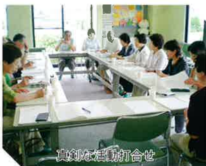
真剣な活動打合せ