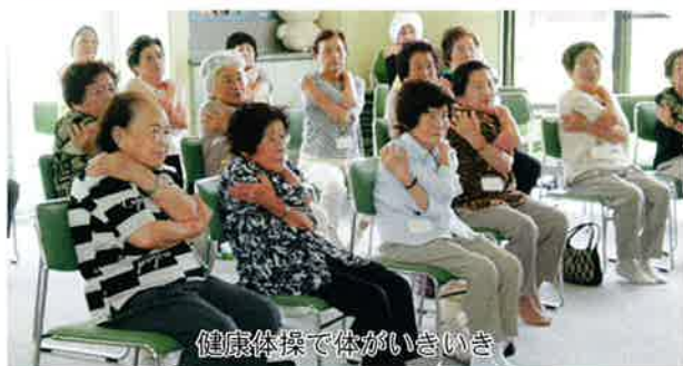
健康体操で体がいきいき