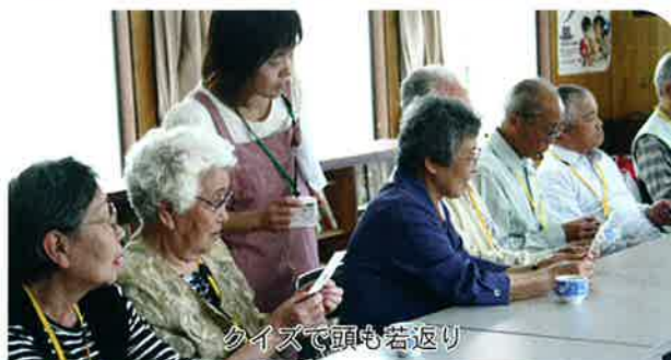
クイズで頭も若返り