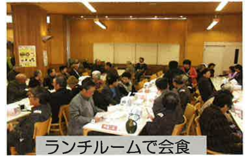
ランチルームで会食