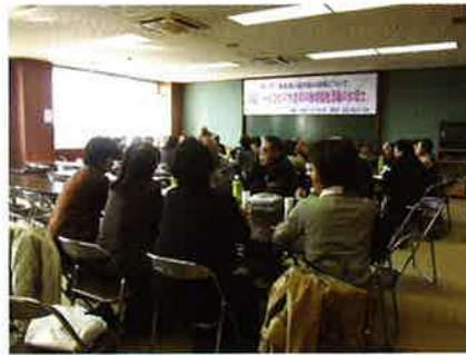
自治会ごとに分かれての懇談会