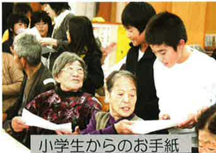
小学生からのお手紙