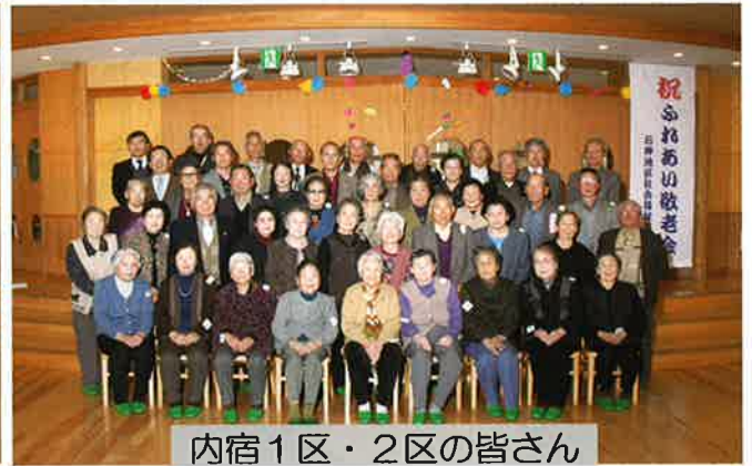
内宿1区・2区の皆さん