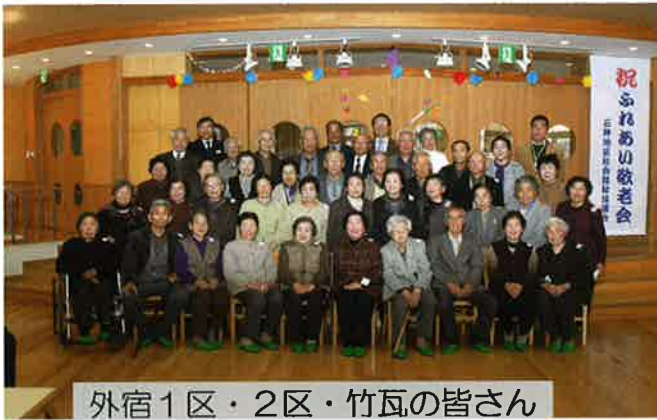
外宿1区・2区・竹瓦の皆さん

平成20年11月29日 80歳以上の方を招待し、石神小学校にて 「ふれあい敬老会」を開催しました。